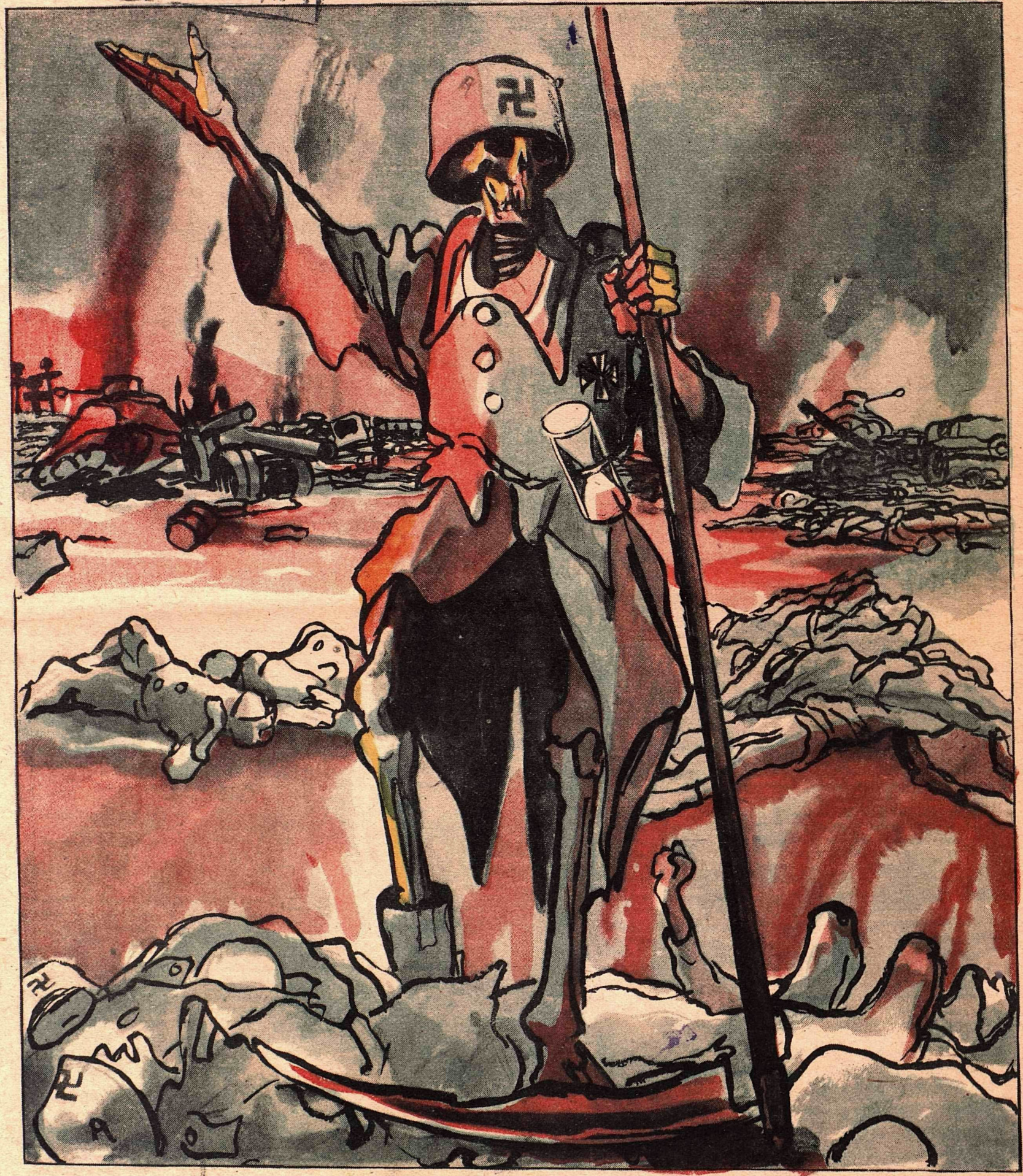
— Хайль Гитлер!..