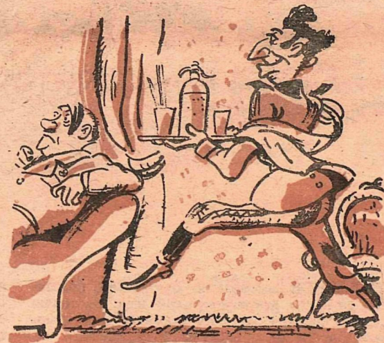
Рис. Б. Фридкина