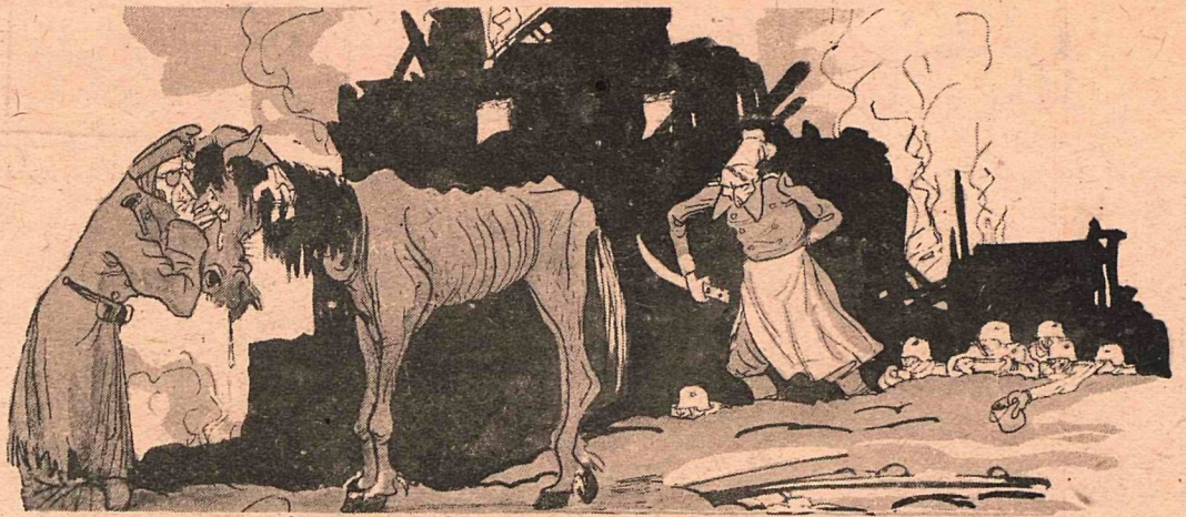
— Прощай, мой товарищ, мой верный слуга! Расстаться настало нам время!